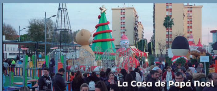
La Casa de Papá Noel