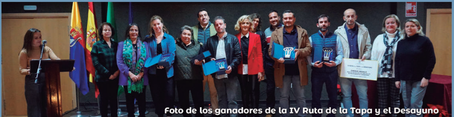
Foto de los ganadores de la IV Ruta de la Tapa y el Desayuno