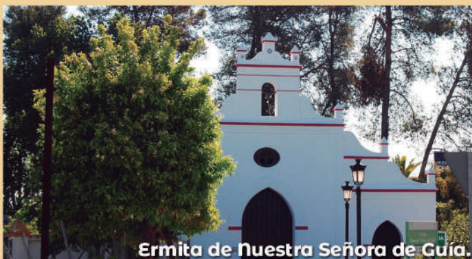
Ermita de Nuestra Señora de Guía.