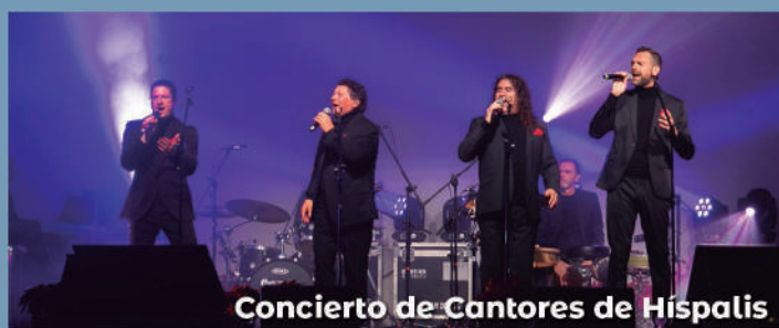
Concierto de Cantores de Híspalis