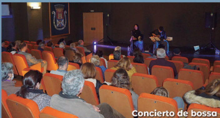
Concierto de bossa