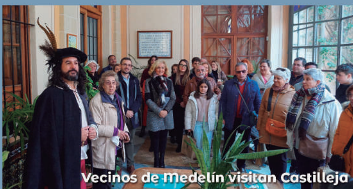
Vecinos de Medellín visitan Castilla de la Cuesta