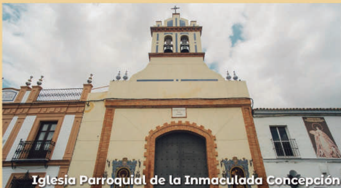
Iglesia Parroquial de la Inmaculada Concepción