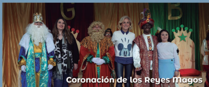
Coronación de los Reyes Magos