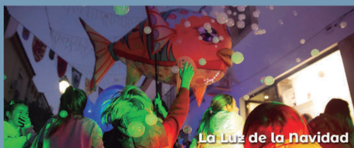
La Luz de la Navidad