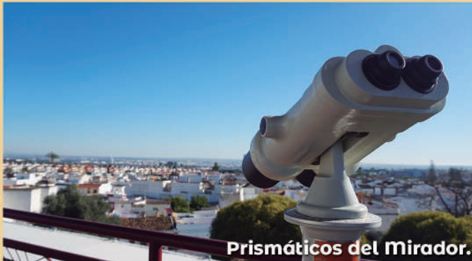
Prismáticos del Mirador.

El Ayuntamiento está impulsando un gran número de proyectos que tienen como objetivo la dinamización de la Economía Local y del Turismo. Entre ellos, una ruta turística para dar a conocer los principales monumentos, a través de códigos QR y con información en la web municipal. Esta ruta monumental, por el casco antiguo, también llevará al visitante hasta la Hacienda de la Sagrada Familia, donde se encuentra el Mirador del Aljarafe: una gran torre, recientemente remodelada, donde disfrutar de espectaculares vistas y divisar Sevilla y su comarca. El Mirador dispone de unos prismáticos para poder hacer mucho más completa esta visita. Inversión para la información y promoción turística: 368.113€