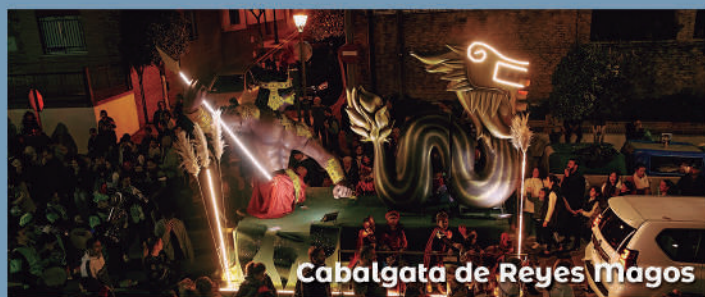
Cabalgata de Reyes Magos