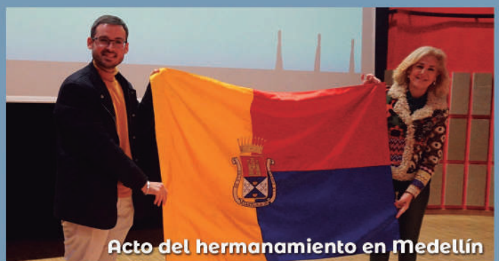
Acto del hermanamiento en Medellín