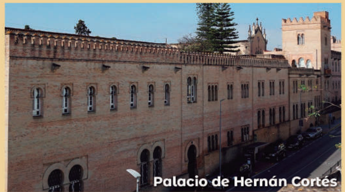
Palacio de Hernán Cortés