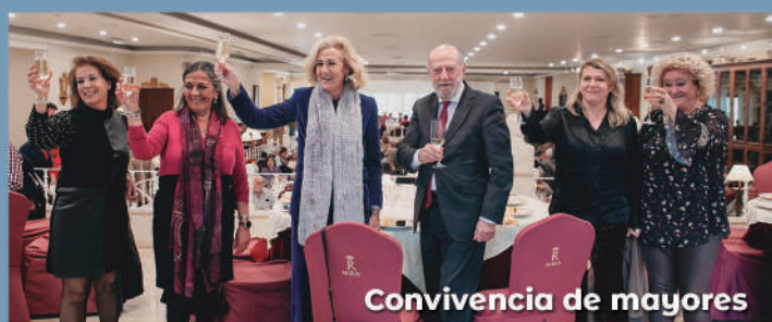
Convivencia de mayores