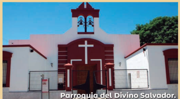
Parroquia del Divino Salvador.