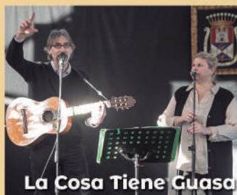
La Cosa Tiene Guasa