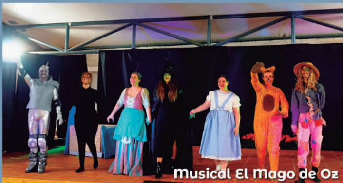
Musical El Mago de Oz