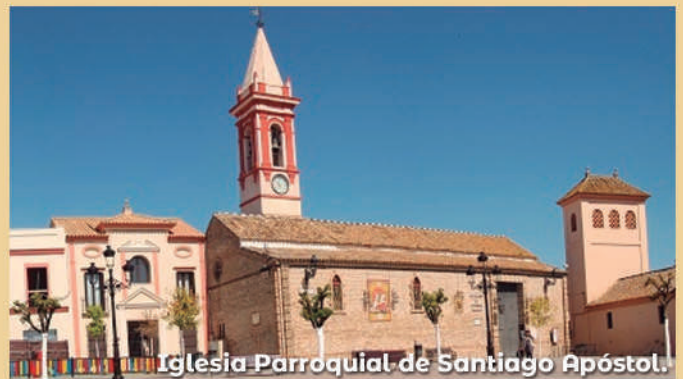
Iglesia Parroquial de Santiago Apóstol.