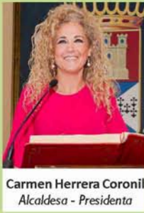
Carmen Herrera Coronil Alcaldesa - Presidenta